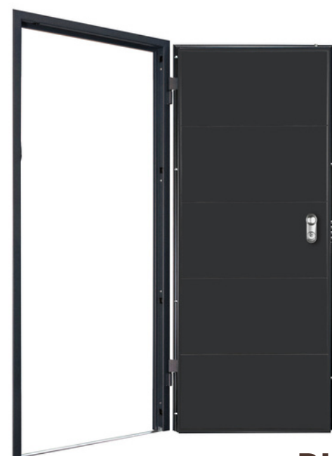
PUERTA ACORAZADA VT5 650€