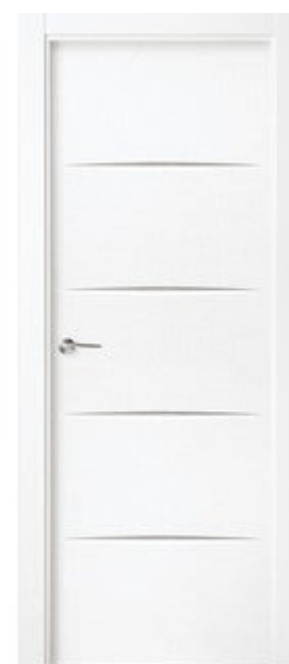
PUERTA LACADA BLANCA LU5 62,5 CM 160€