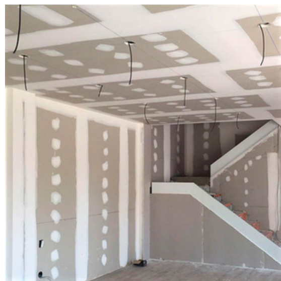
PLADUR 13 MM