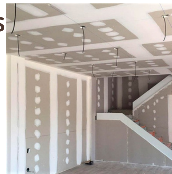
PLADUR 13 MM