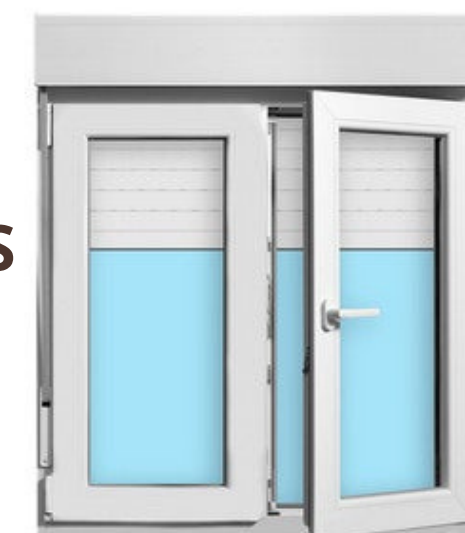
8% DE LOS M2 CONSTRUÍDOS, 15 M2 VENTANAS INCLUIDOS EN EL PRECIO.